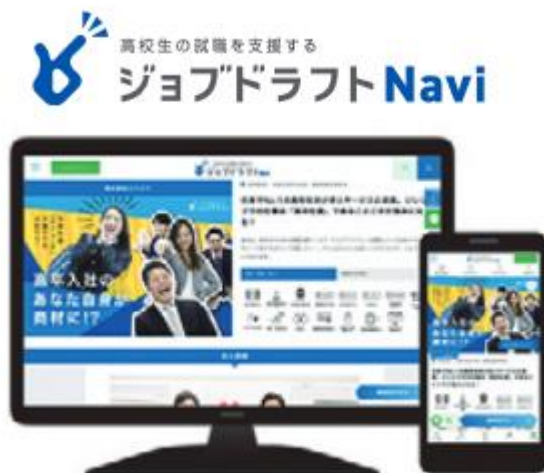
ジョブドラフトNavi画面イメージ

高校新卒専門求人サイト「ジョブドラフトNavi」を運営している。同サイトを活用することで、高校生は求人票だけでは「読み取れない」「わからない」会社の雰囲気や企業の魅力を、写真、動画や、先輩からのメッセージなどから企業研究をすることができる。